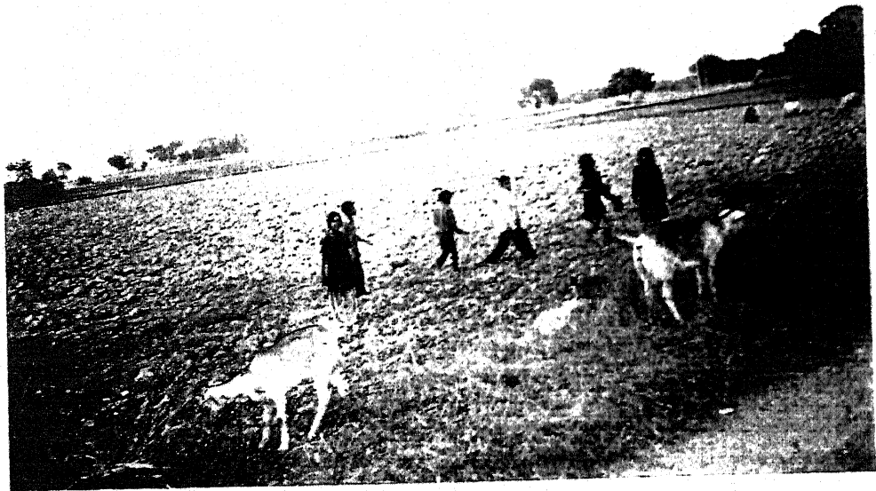
खेतों में कार्य करते बाल श्रमिक